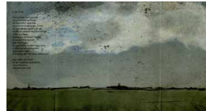
In der Ferne. Günter Kunert: Gedicht. Gisela Mott-Dreizler: Radierung. Witzwort: Quetsche, Verlag für Buchkunst, 1998.

Exemplar 1/100. Signiert von Günter Kunert und Gisela Mott-Dreizler