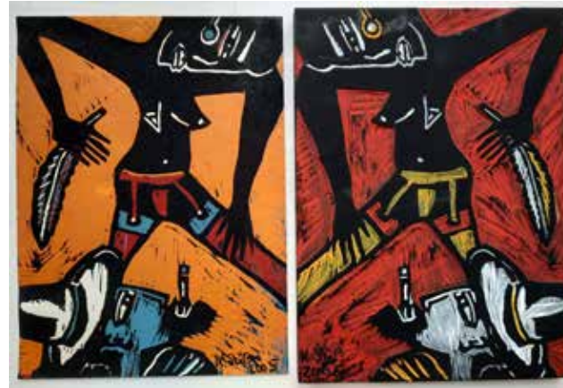
Spiele des neuen Jahrhunderts. Kerstin Hensel: Gedichte. Klaus Süß: Holzschnitte. Witzwort: Quetsche, Verlag für Buchkunst, 2005 Exemplar 1/9 mit 12 zusätzlichen Grafiken und einem bemalten Druckstock. Signiert von Klaus Süß und Kerstin Hensel