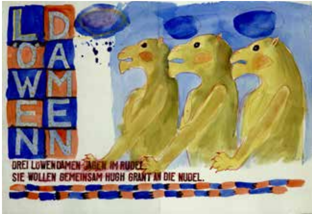
Klaus Bzdziach: Tier ABC. Malerei Gisela Mott-Dreizler. Witzwort: Quetsche, Verlag für Buchkunst, 2000 Exemplar 6/8. Signiert von Gisela Mott-Dreizler