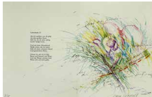
Bertolt Brecht: Liebesgedichte. Irene Wedell Lithographien. Berlin: Edition Handpresse Gutsch, 1985 Exemplar 7/15. Signiert von Irene Wedell